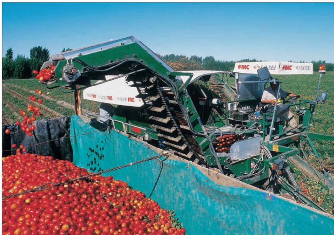
CADENA. Las manzanas de Río Negro, uno de los primeros productos en perder competitividad.

nen golpeando sobre las economías regionales del país. No son problemáticas nuevas, sino distorsiones que desde hace algunos años se instalaron como permanentes, y están erosionando la rentabilidad de miles de productores agropecuarios”, señaló el comunicado de la entidad.