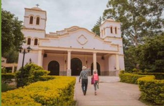
SANTUARIO VIRGEN DE LA PEÑA 0 km de Yariгуarenda