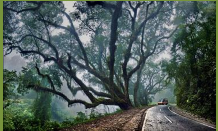
PN CALILEGUA 100km de Yariгуarenda