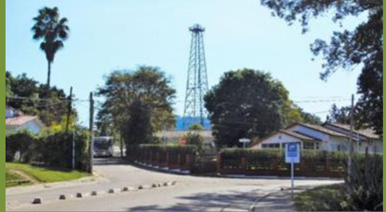
VESPUICIO 25 km de Yariгуarenda