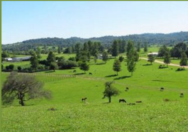
RP ACAMBUCO 20 km - Aguaray