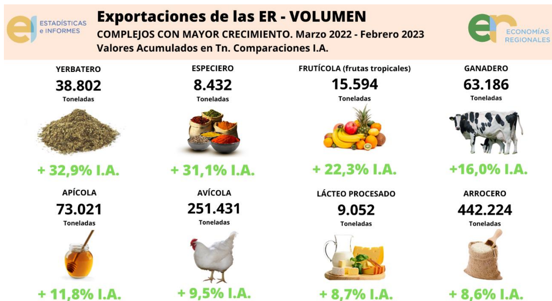
Gráfico 4: Monitor de Exportaciones de las Economías Regionales: los 8 complejos productivos de Argentina que más crecieron en volumen .

Son los casos del complejo vitivinícola , con una caída del 18,7%, el complejo cítrica , con 14,6% y finalmente, el complejo legumbrero , el cual redujo su volumen de exportación en un 5,7%