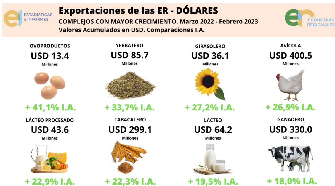
Gráfico 3: Monitor de Exportaciones de las Economías Regionales: los 8 complejos productivos de Argentina que más crecieron en dólares .