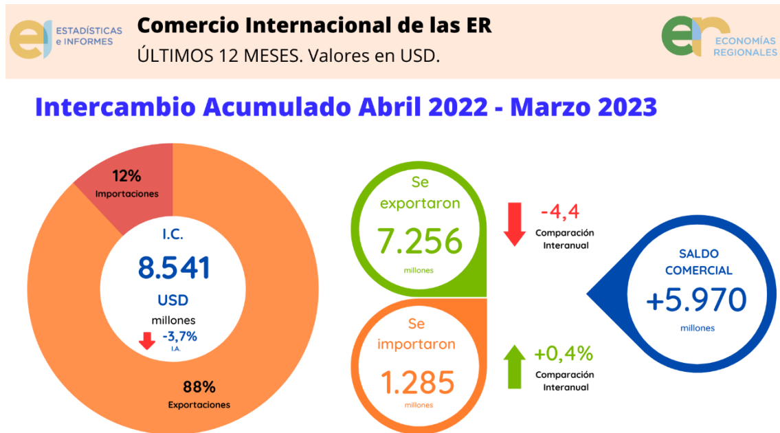
Gráfico 2: Intercambio acumulado abril 2022 – marzo 2023 en las economías regionales de Argentina.

En los últimos 12 meses, 14 de los 31 complejos productivos analizados mostraron crecimiento. Por otro lado, dentro de los 18 que mostraron variación negativa, se encuentran 3 de los 5 complejos con mayor incidencia en las exportaciones en dólares, lo que explica la caída que se genera en la comparación interanual.