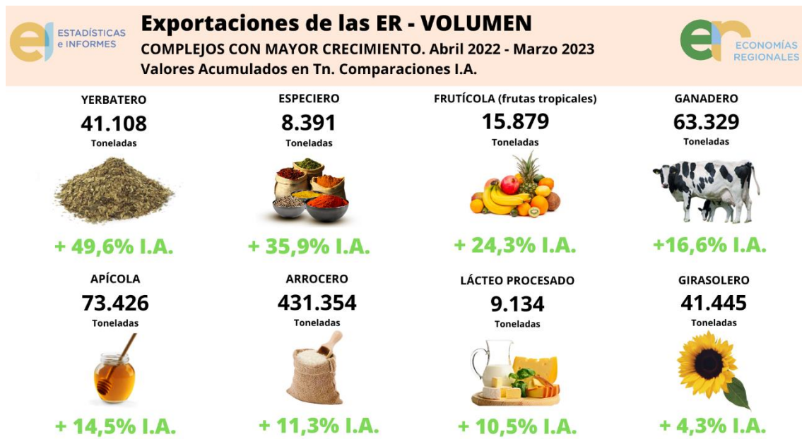
Gráfico 4: Monitor de Exportaciones de las Economías Regionales: los 8 complejos productivos de Argentina que más crecieron en volumen .

Son los casos del complejo vitivinícola , con una caída del 20%, el complejo maicero , cayendo 18,6%, el complejo cítrica , con 15,6%, y finalmente, el complejo legumbrero , el cual redujo su volumen de exportación en un 6,6%